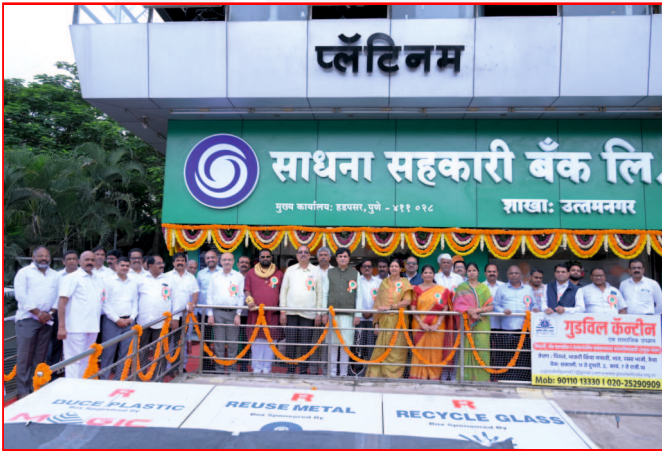
साधना बँकेच्या उत्तमनगर शाखा स्थलांतर समारंभा प्रसंगी उपस्थित सर्व मान्यवर.