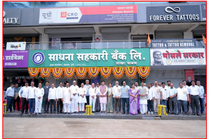
साधना बँकेच्या चाकण शाखा स्थलांतर समारंभा प्रसंगी उपस्थित सर्व मान्यवर.