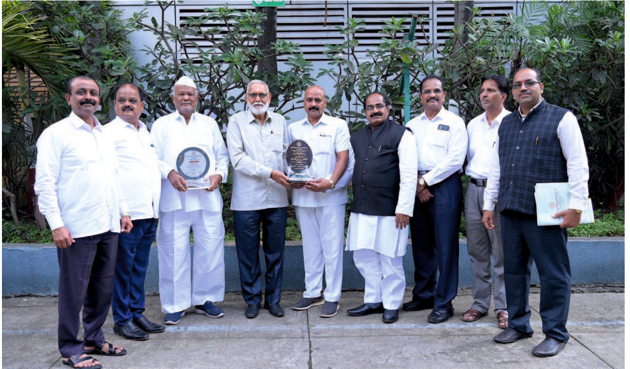
पुणे जिल्हा नागरी सहकारी बँक असोसिएशनच्या वतीने बँकेस देण्यात आलेल्या शून्य टक्के एनपीए पुरस्कारासमवेत बँकेचे चेअरमन, व्हा. चेअरमन व सन्माननीय संचालक.